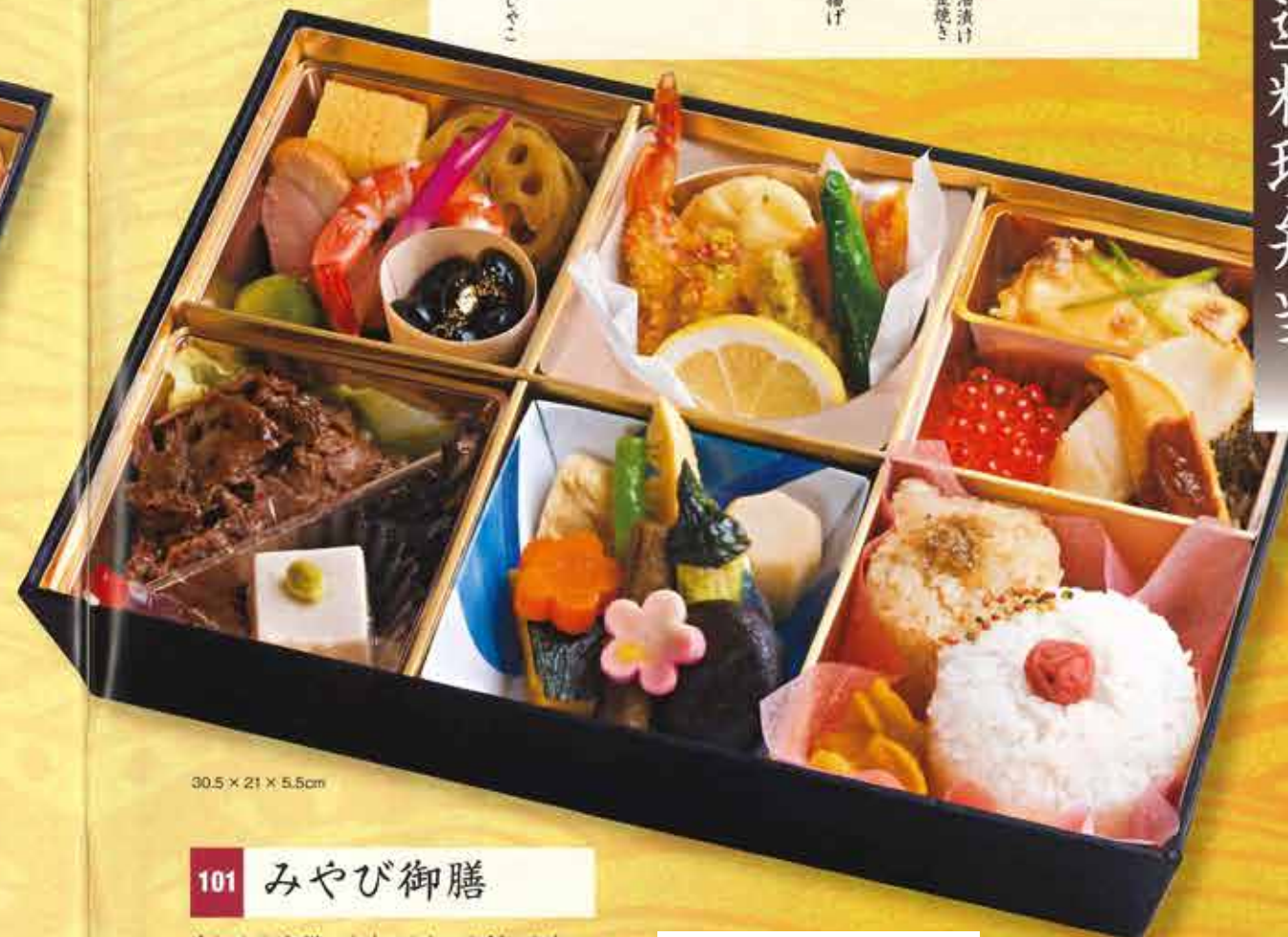
30.5 × 21 × 5.5cm

【お献立】 海老甘酢漬け 合鴨スモーク だし巻き玉子 蓮根金平 紅白はじかみ 大塊海鯛 鶏そぼろ揚げ 三陸産いくら醤油漬け キングサーモン黄金焼き 焼もろこし 牛蒡金平 ずわい蟹天麩羅 祝立真大揚げ 海老アーモンド揚げ 青実天麩羅 黒毛和牛旨煮 淡路産若布 胡麻豆腐 湯葉巻き 里芋 小茄子 南京 牛蒡 花人參 花魁 青実 二色瓢箪形ご飯 淡路産ちりめんじゃこ 梅干し 黒豆