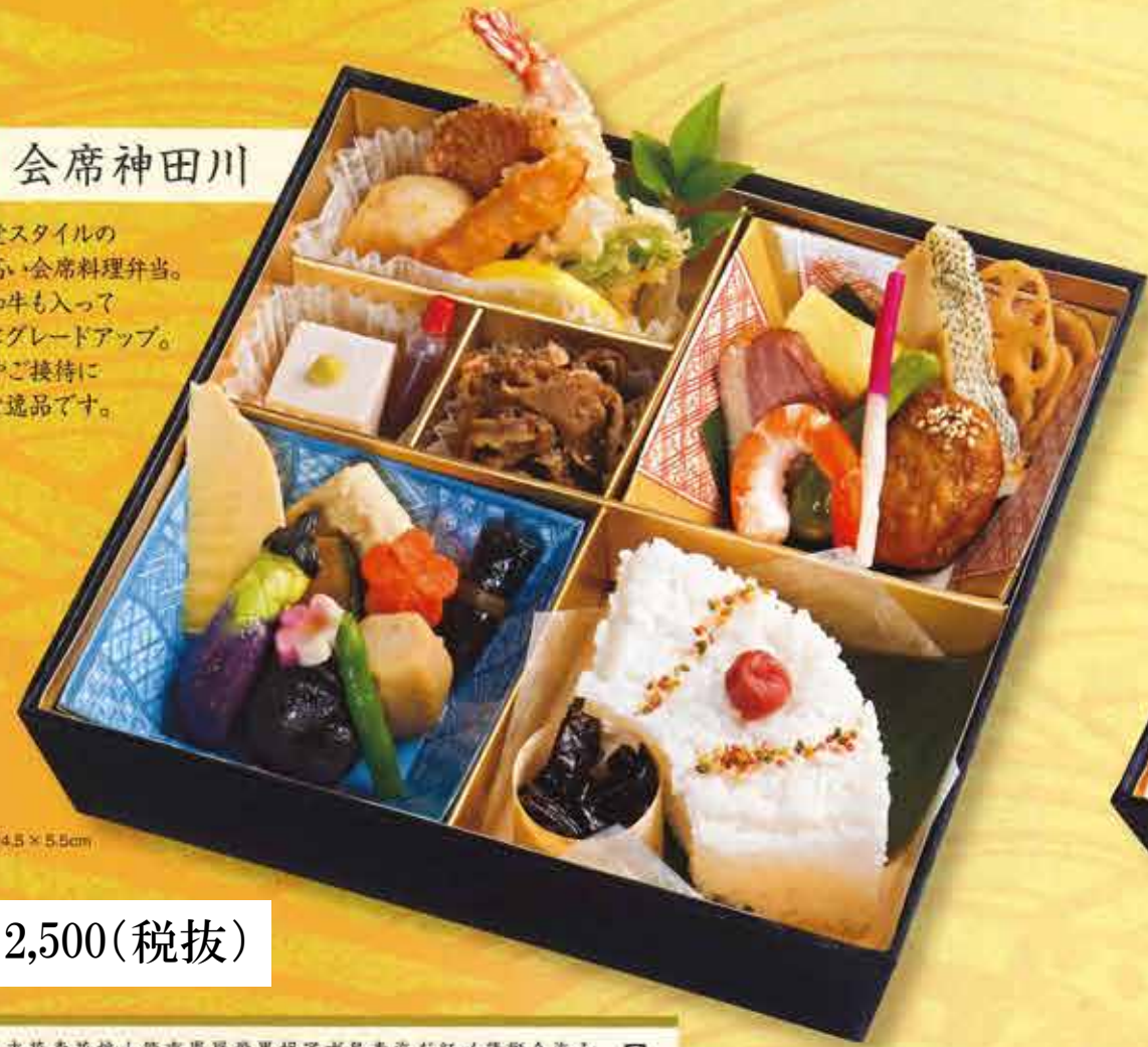
24.5 × 24.5 × 5.5cm

松花堂スタイルの格調高い会席料理弁当。黒毛和牛も入って豪華にグレードアップ。会食やご接待に最適な逸品です。